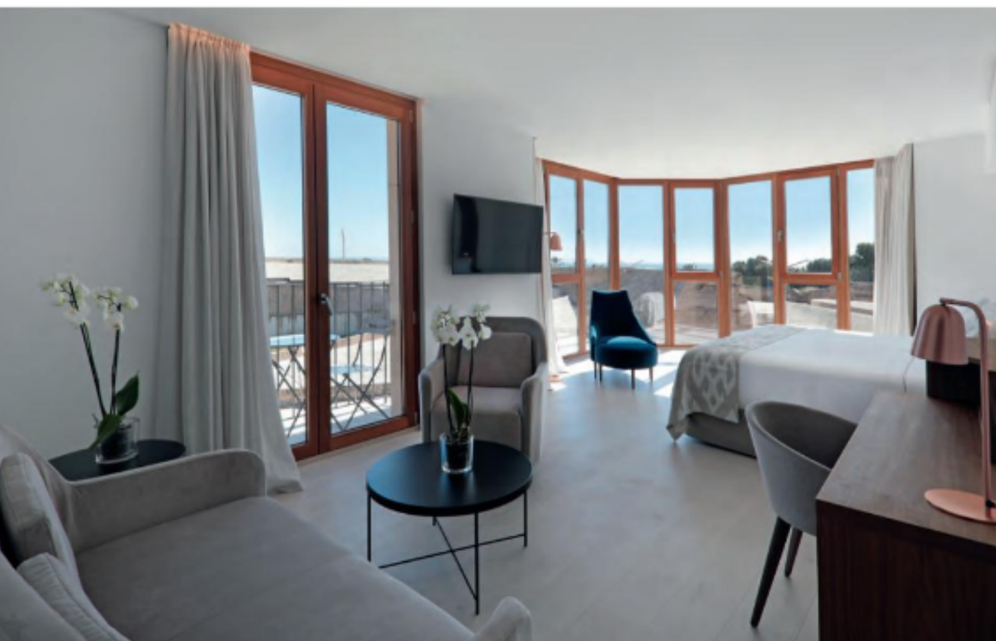
Die großzügigen und lichtdurchfluteten Zimmer und Suiten überzeugen mit modernem Wohlfühldesign und High-End-Komfort.