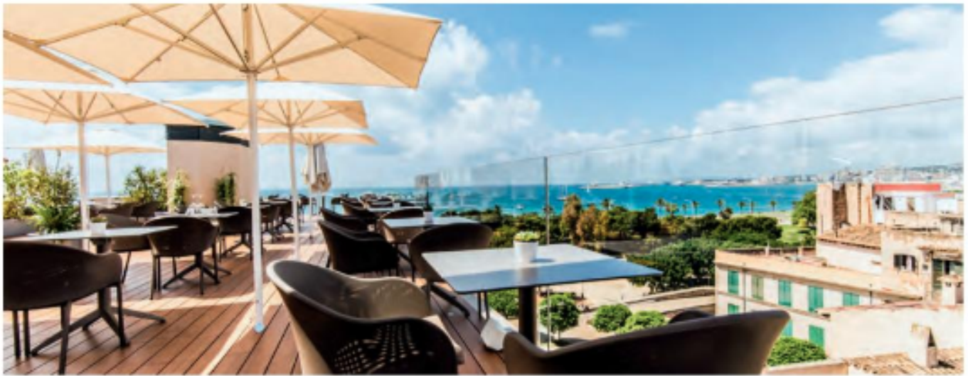
Ein Highlight für sich: die 800 Quadratmeter große Dachterrasse mit Pool, Bar und Panoramaaussichten auf die Bucht von Palma.

ihren Gästen neben einer exponierten und einzigartigen Lage ein Höchstmaß an Komfort und Service zu bieten. 4 Und dass dieses Ziel mit Bravour gemeistert wurde, spürt man schon beim zuvorkommenden Empfang durch das junge Team, das vorher in den besten Häusern der Insel gearbeitet hat. Doch noch vor dem vorbildlichen, stets professionell, aber unverkrampft agierenden Service, fällt die tolle, für Palma einzigartige Lage auf. Das Fünf-Sterne-Hotel liegt direkt an der historischen Stadtmauer von Palma de Mallorca, nur wenige Fußminuten von den Sehenswürdigkeiten,