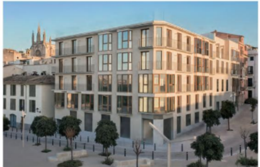
Die Lage direkt an der historischen Stadtmauer, nur wenige Schritte vom Hafen und der Kathedrale entfernt, ist in Palma kaum zu toppen.

ihren Gästen neben einer exponierten und einzigartigen Lage ein Höchstmaß an Komfort und Service zu bieten. 4 Und dass dieses Ziel mit Bravour gemeistert wurde, spürt man schon beim zuvorkommenden Empfang durch das junge Team, das vorher in den besten Häusern der Insel gearbeitet hat. Doch noch vor dem vorbildlichen, stets professionell, aber unverkrampft agierenden Service, fällt die tolle, für Palma einzigartige Lage auf. Das Fünf-Sterne-Hotel liegt direkt an der historischen Stadtmauer von Palma de Mallorca, nur wenige Fußminuten von den Sehenswürdigkeiten,